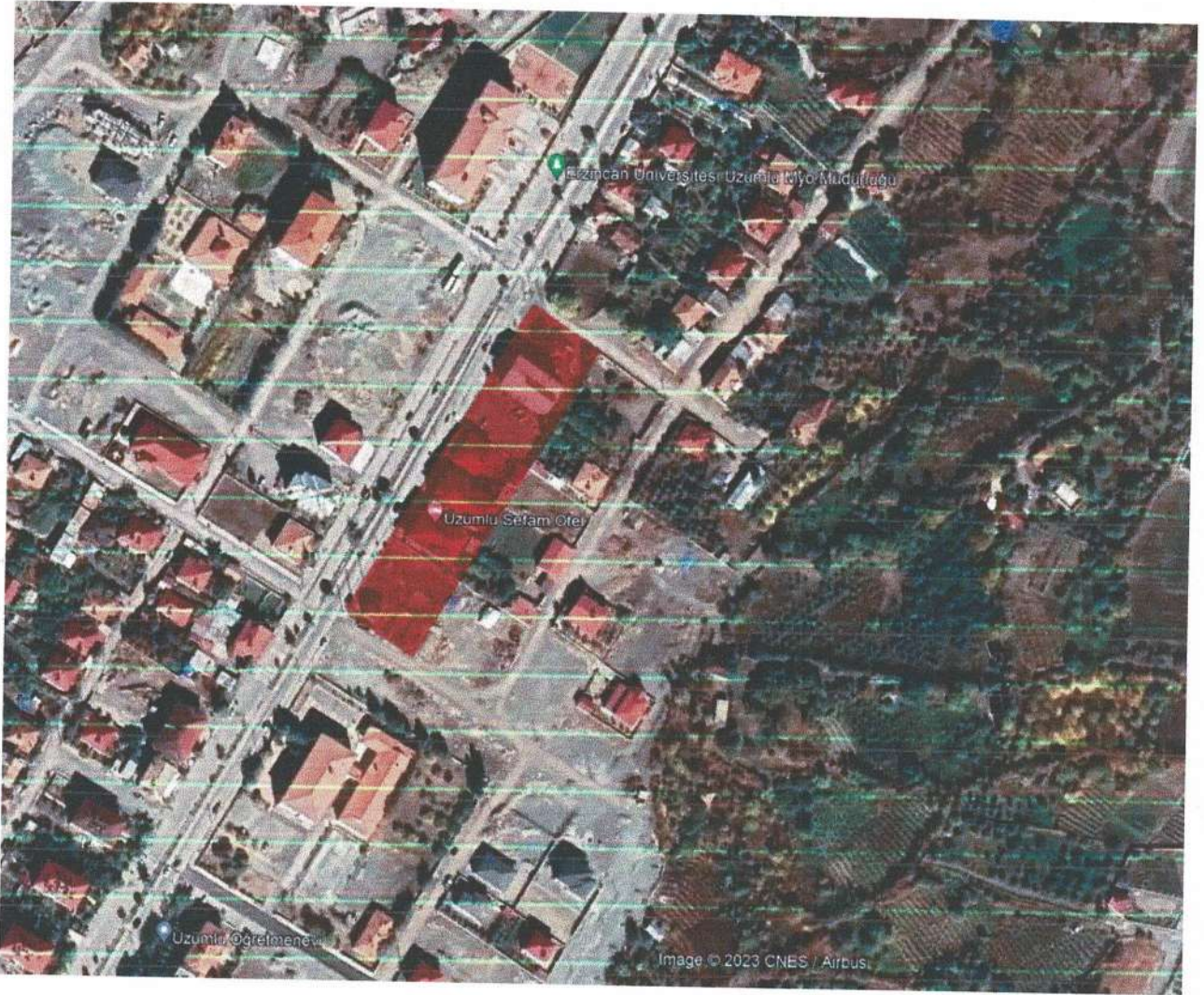
Resim 3: Planlama Alanının Yerleşim Genelinde Yeri (uydu görüntüsü yakın)