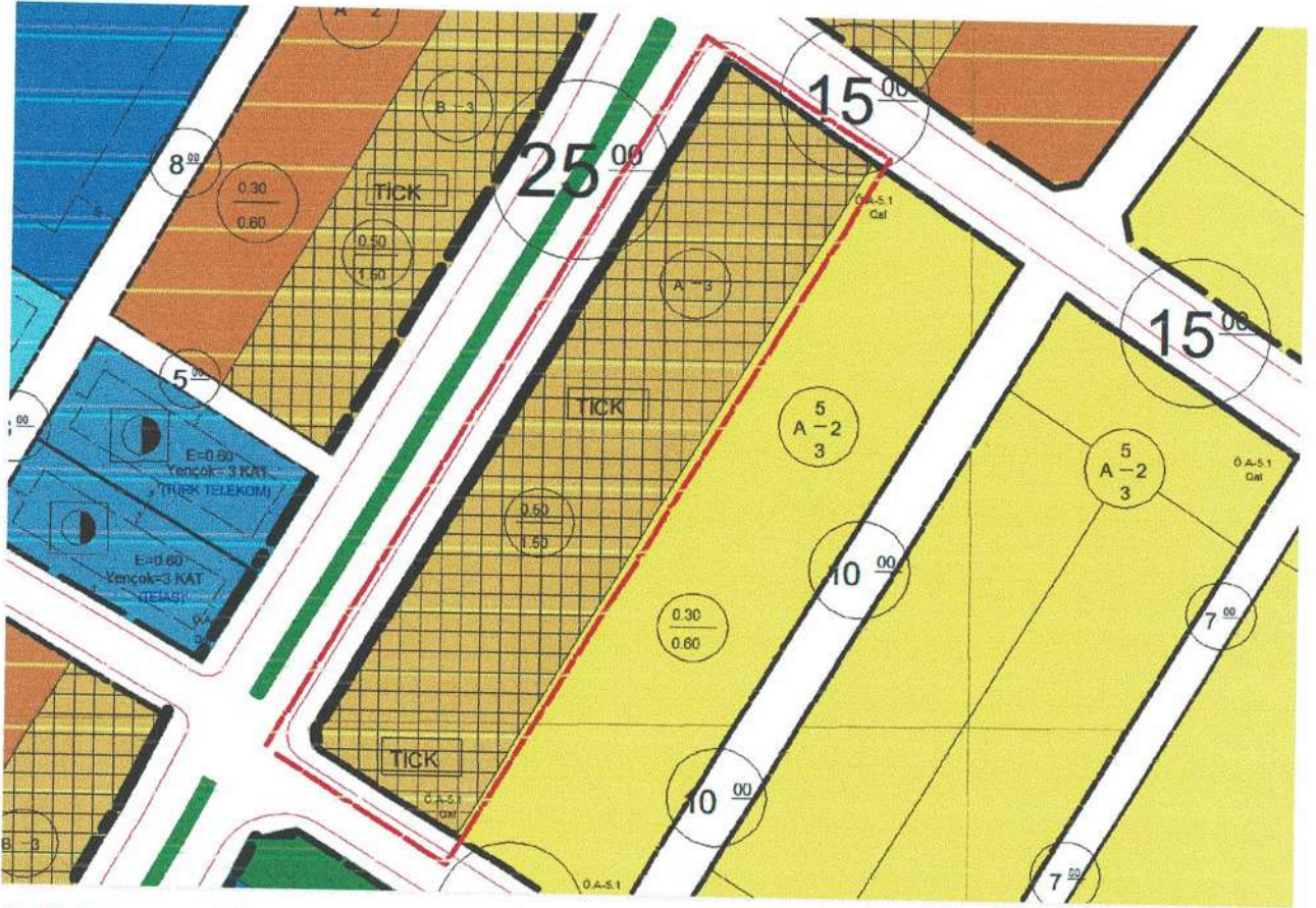
Resim 5: Uygulama İmar Plan Değişikliği sonrası oluşan İmar Planı