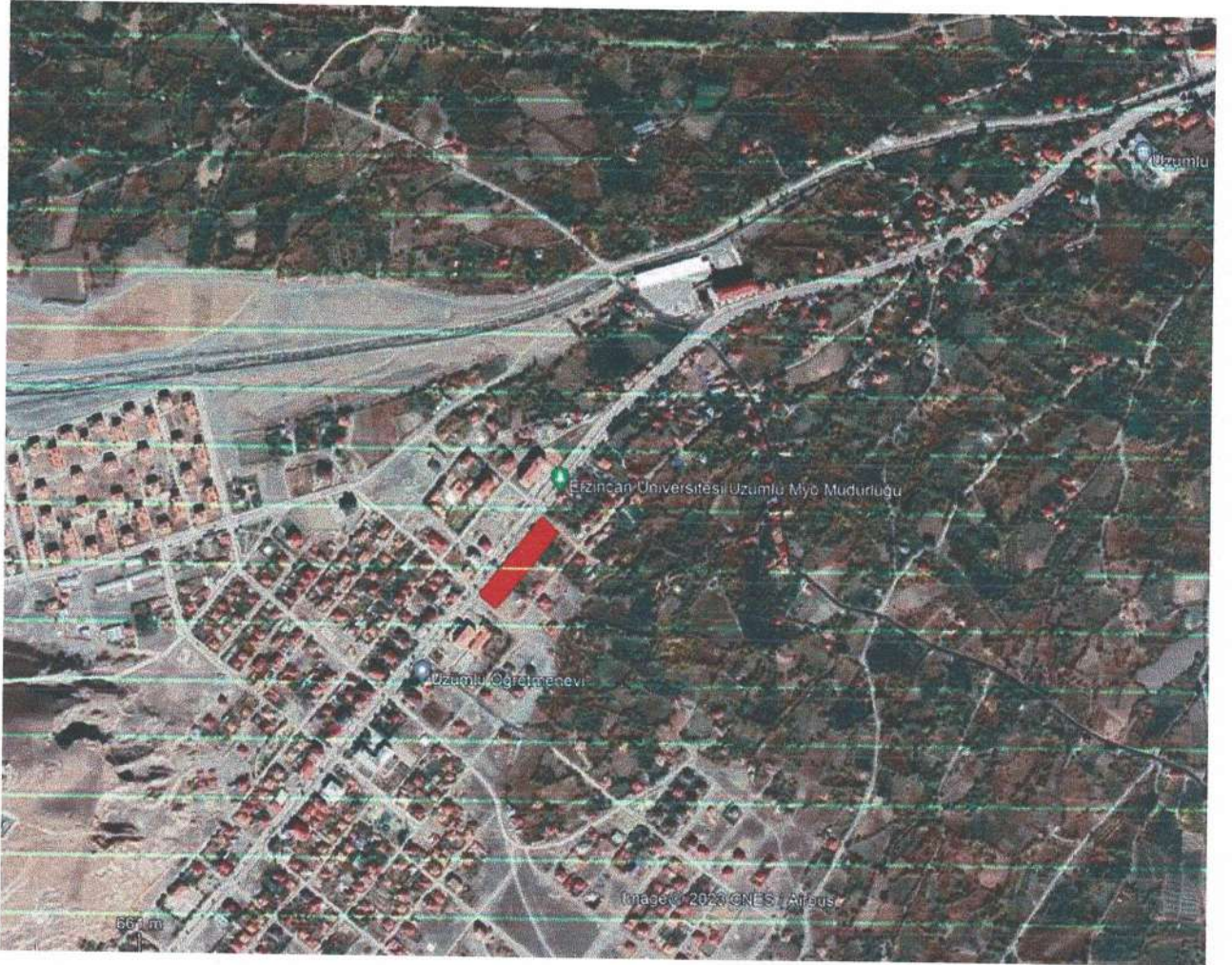
Resim 2: Planlama Alanının Yerleşim Genelinde Yeri (uydu görüntüsü uzak)

Uygulama İmar plan değişikliği yapımı talep edilen bölge, Erzincan İli, Üzümlü İlçesi, Terzibaba Mahallesi sınırları 421 Ada 1,10,11,12,13,14,15,16 numaralı parselleri kapsamaktadır. Planlama alanı yaklaşık 5.920 m 2 olup 558428-558964 yatay ve 4396445-4396441 dikey koordinatları arasında bulunmaktadır. 1/1000 Ölçekli Uygulama İmar I43-D-04-C-4-C, I43-D-09-B-1-B paftasına girmektedir.