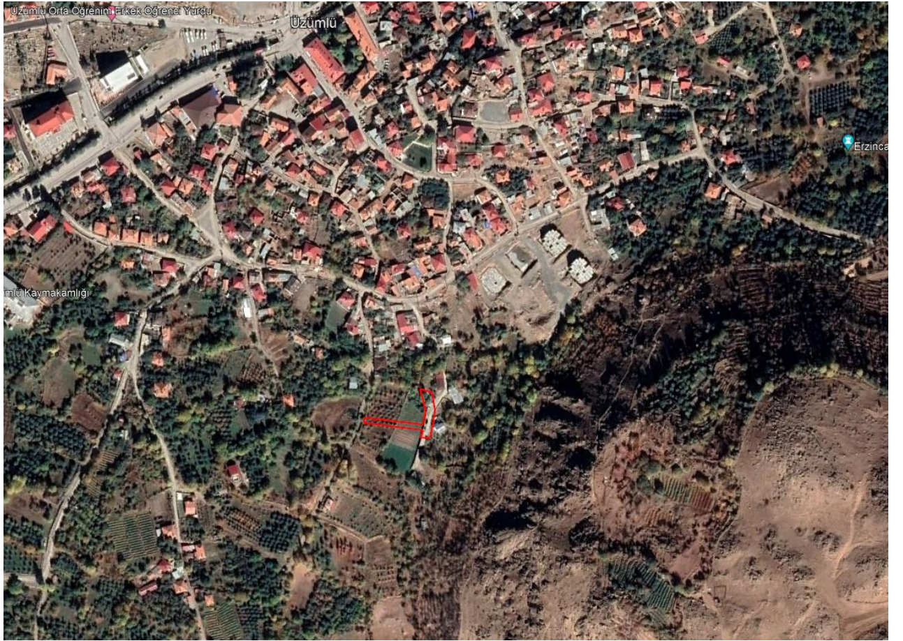
Resim 2: Planlama Alanının Yerleşim Genelinde Yeri (uydu görüntüsü uzak )

Nazım ve Uygulama İmar plan değişikliği yapımı talep edilen bölge, Erzincan İli, Üzümlü İlçesi, Oruçlu Mahallesi 265 Ada 14,15 Parselleri kapsamaktadır. Planlama alanı yaklaşık 1250 m 2 olup 560025-560567 yatay ve 4397151-4397841 dikey koordinatları arasında bulunmaktadır. 1/5000 Ölçekli Nazım İmar Planında I43-D-05-D, 1/1000 Ölçekli Uygulama İmar I43-D-05-D-4-A paftasına girmektedir.