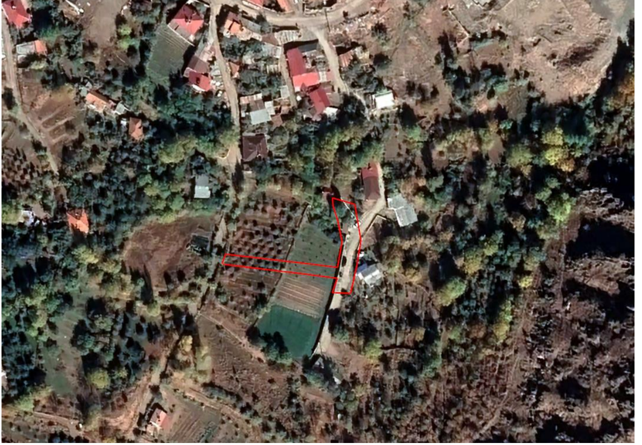
Resim 3: Planlama Alanının Yerleşim Genelinde Yeri (uydu görüntüsü yakın )