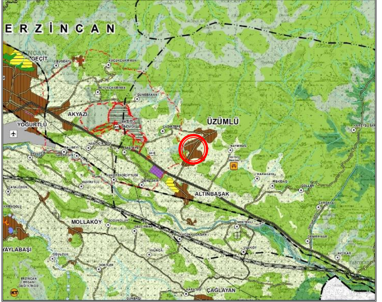
Resim 1 : Erzurum,Erzincan,Bayburt1/100.000Çevre Düzeni Planı Üzerindeki Konumu

Nazım ve Uygulama İmar Plan Değişikliğine konu olan taşınmazlar yürürlükteki 1/100.000 ölçekli çevre düzeni plan paftalarından I43 no.lu paftaya girmekte olup, söz konusu alanın Üzümlü İlçesi Belediye Mücavir alan sınırında olup “Kentsel Meskun Yerleşik Alan” olarak planlandığı görülmektedir.